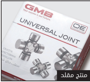
المنتج المقلد لا يوجد عليه نمط مطبوع

على الرغم من صعوبه الرؤيا من الجانب للجزء الامامي ، يمكنك ان ترى الليثوفان لمصلب الدراي شفت والمطبوع بطباعه خاصه عند النظر اليه من خلال الضوء المنعكس بزوايه متغيره. وبما انه عباره عن طلاء شفاف، فإنه غير مرئي عادة. ومع ذلك، فإن النمط يظهر بوضوح عندما تسليط الضوء عليه. فمن السهل تمييز المنتج المقلد لأن هذا النمط لم يتم طباعته